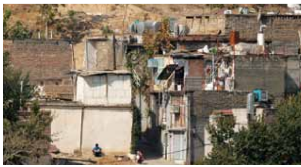
۵۵ هزار هکتار بافت فرسوده، ۱۷ هزار هکتار بافت تاریخی و ۵۴ هزار هکتار بافت حاشیه شهری وجود دارد.