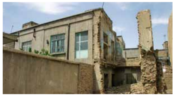
وزیر راه و شهرسازی گفت: ۱۸ میلیون نفر از جمعیت شهری کشور در بافت‌های فرسوده، تاریخی و حاشیه‌شهرها زندگی می‌کنند. به گفته عباس آخوندی، در کشور