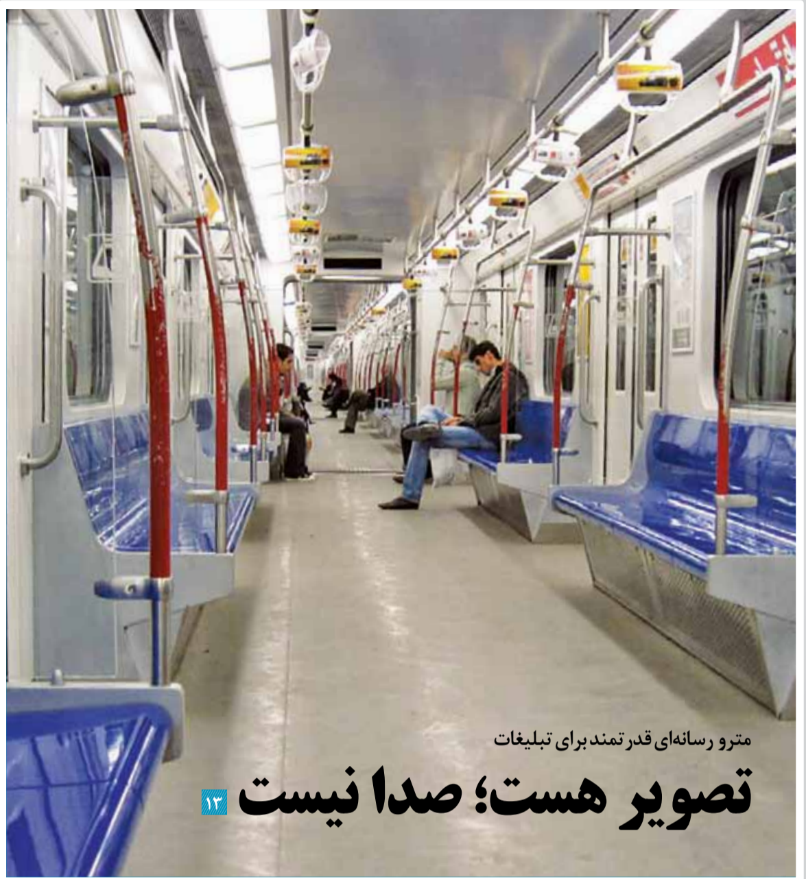
مترو رسانه‌های قدرتمند برای تبلیغات