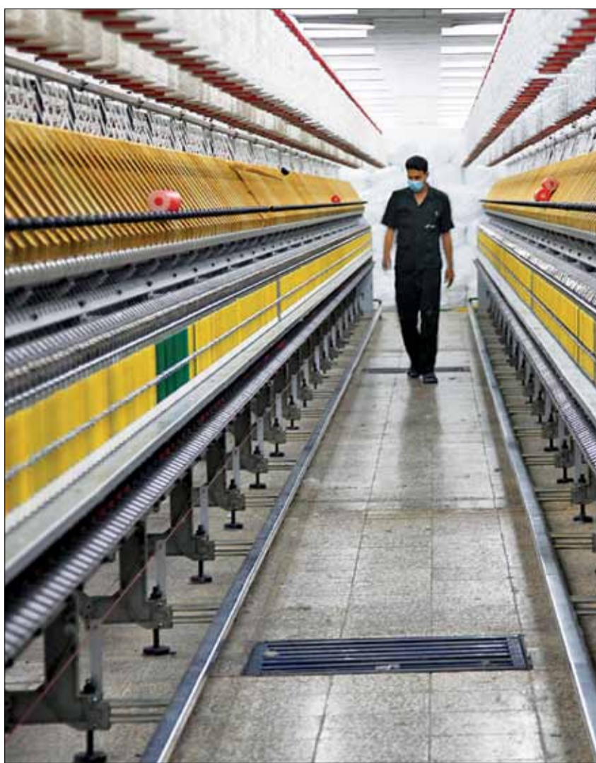
دایر اکتلی فرصت امروز