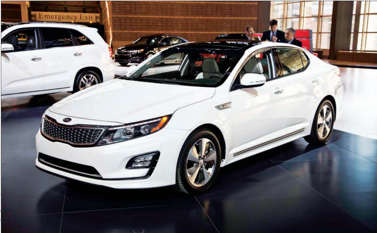
عکس تزئینی می‌باشد

کیا اپتیما در کلاس سدان‌های متوسط جزو خودروهای محبوب و پرطرفدار به شمار می‌رود، ظاهر زیبایی دارد و از کابینی شیک و تجهیزاتی پیشرفته بهره می‌برد و شاید به همین دلیل است که کیا اپتیما هیبریدی مدل ۲۰۱۵ نیز روانه بازار شده و میزان مصرف سوخت را بسیار پایین آورده است. متأسفانه این خودرو تاکنون به بازار جهانی عرضه نشده و فقط در مناطقی خاص در اختیار علاقه‌مندان قرار می‌گیرد. میزان مصرف سوخت کیا اپتیما هیبریدی بسته به تیپ آن، بین ۷،۲۰ تا ۷،۴۰ لیتر در هر ۱۰۰ کیلومتر برآورد شده است که در مقایسه با مصرف سوخت رقبا بسیار کمتر است. اگر به دنبال سدان متوسط هیبریدی می‌گردید، تویوتا کمری هیبریدی کم مصرف است، ظاهر خوبی دارد و از هندلینگ عالی برخوردار است. فورد فیوزن هیبریدی نیز خوش‌قیافه است، تجهیزات بسیار پیشرفته‌ای دارد و مصرف سوخت آن به ۶،۵۲ لیتر در هر ۱۰۰ کیلومتر می‌رسد. در نهایت هم باید از هوندا آکورد هیبریدی مدل ۲۰۱۵ نام برد که کمترین میزان مصرف سوخت را دارد و مصرف آن به ۵،۸۲ لیتر در هر ۱۰۰ کیلومتر می‌رسد. البته مدنظر قرار دادن این رقبا کار عاقلانه‌ای است، ولی بهتر است بدانید کیا اپتیما هیبریدی مدل ۲۰۱۵، همچنان یک رقیب سرسخت در این کلاس باقی می‌ماند.