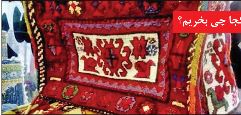
کجا چی بخریم؟