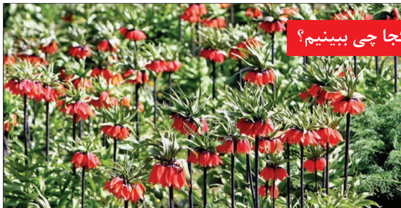
کجا چی ببینیم؟

آب آن از بدنه دیواره صخره‌ای کوه از بیش از چند هزار چشمه سرزیر می‌شود. همچنین در ادامه مسیر رودخانه انبوه درختان، باغ‌ها به چشم می‌خورد. رودخانه حاصل از این چشمه‌ها بسیار پرآب بوده و تا سپیدان امتداد دارد. آبشار بسیار عظیم‌تر از آن چیزی است که تصور می‌کنید، به طوری که ارتفاع آن نزدیک به ۱۲۰ متر و عرض آن حدود ۴۰۰ متر تخمین زده می‌شود. هرچند آبشار ابعاد مشخصی ندارد زیرا هر روز چشمه‌ای جدید در حاشیه آبشار ایجاد شده و گاه چشمه‌ای آتش کم یا قطع می‌شود. آب این آبشار در گرم‌ترین فصل سال بسیار خنک و زیر ۱۰ درجه است، اما به علت جوشان بودن این آب، مانند آب چشمه، رفتن در آن یا نوشیدنش هیچ‌گونه عارضه‌ای به دنبال ندارد. برای دیدن آبشار چند راه وجود دارد. یاسوج، کاکان، مارگون به طول ۶۵ کیلومتر. یاسوج، سپیدان، مارگون به طول ۱۲۵ کیلومتر و شیراز، سپیدان، مارگون به طول ۱۳۰ کیلومتر. راه ماشین‌رو تا حدود ۸۰ متری آبشار می‌رسد و ادامه راه را که سنگ‌فرش و سیمان شده باید پیاده رفت. در اطراف، پارکینگ، سرویس بهداشتی و محوطه‌های مسطحی ساخته شده که برای اقامت و برپا کردن چادر مناسب است.