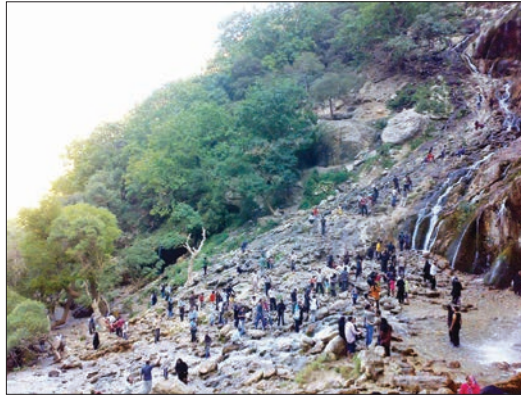
روستای سقاوه یاسوج قرار گرفته است.