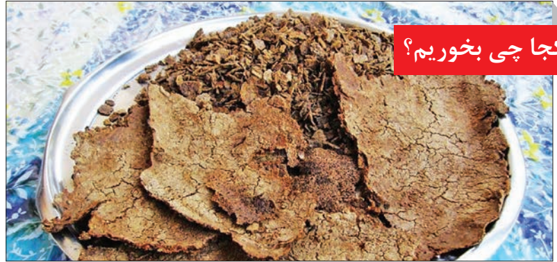
کجا چی بخوریم؟

زیرانداز و تزیین چادرها و خانه‌های خود استفاده می‌کنند.