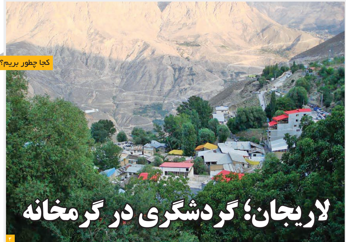
کجا چطور بریم؟