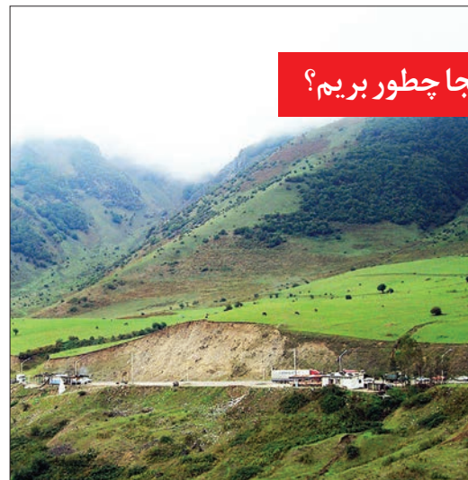
کجا چطور بریم؟