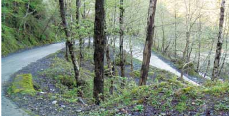
دریای خزر همه در یک قاب قرار می‌گیرند تا صحنه‌ای به یاد ماندنی در ذهن شما باقی بماند.

وارجارگاه: در نزدیکی رودسر، شهری قرار دارد که به داشتن باغ‌های میوه و مرکبات و چایکاری مشهور است، وارجارگاه دارای ارتفاعاتی با چشم‌اندازهای بسیار زیباست.