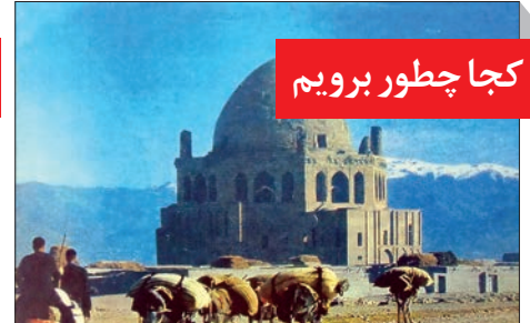
کجا چطور برویم