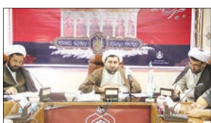
جمله علمای عظام، اصحاب رسانه، مسئولان امر باید با ارائه برنامه های جذاب و نو به ترویج فرهنگ عاشورایی کمک کنند و زمینه قوام این نهضت را فراهم آورند.