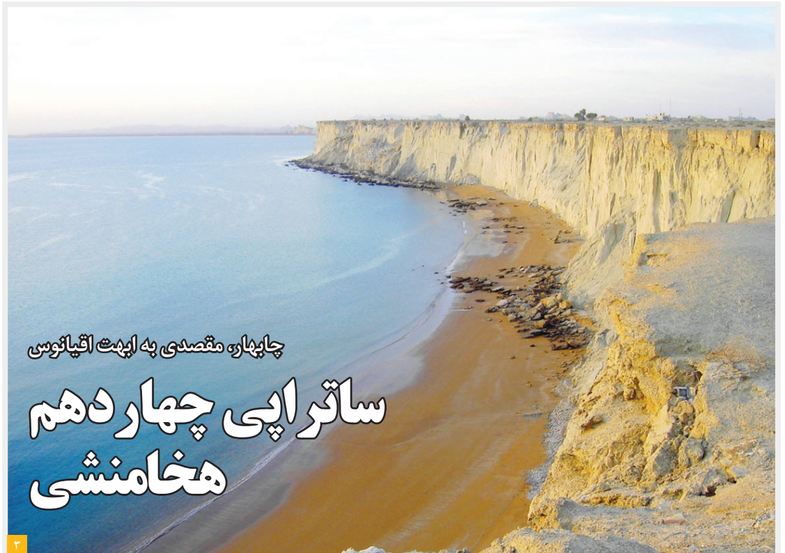
چابهار، مقصدی به ابرمت اقیانوسی