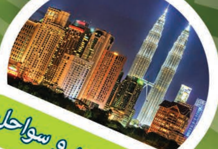
کوالالامپور و سواحل