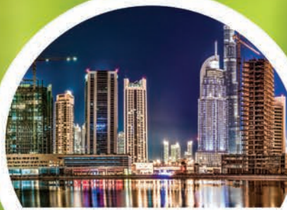
سواحل خلیج فارس