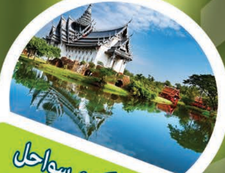
بانگوک و سواحل