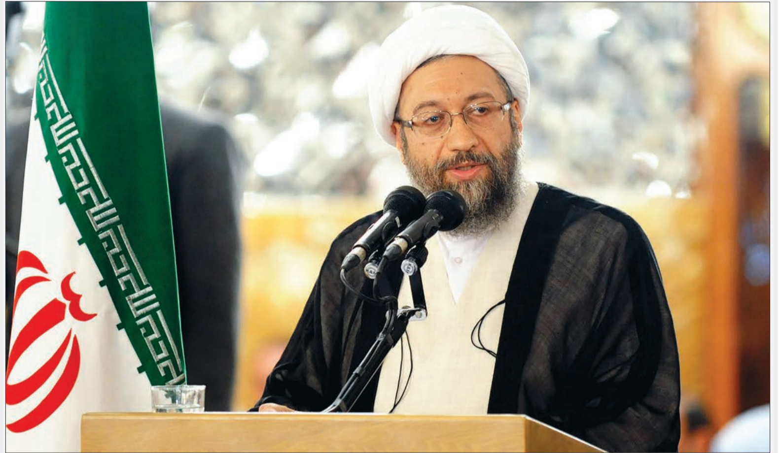
رئیس قوه قضاییه در سومین همایش حقوق محیط زیست: