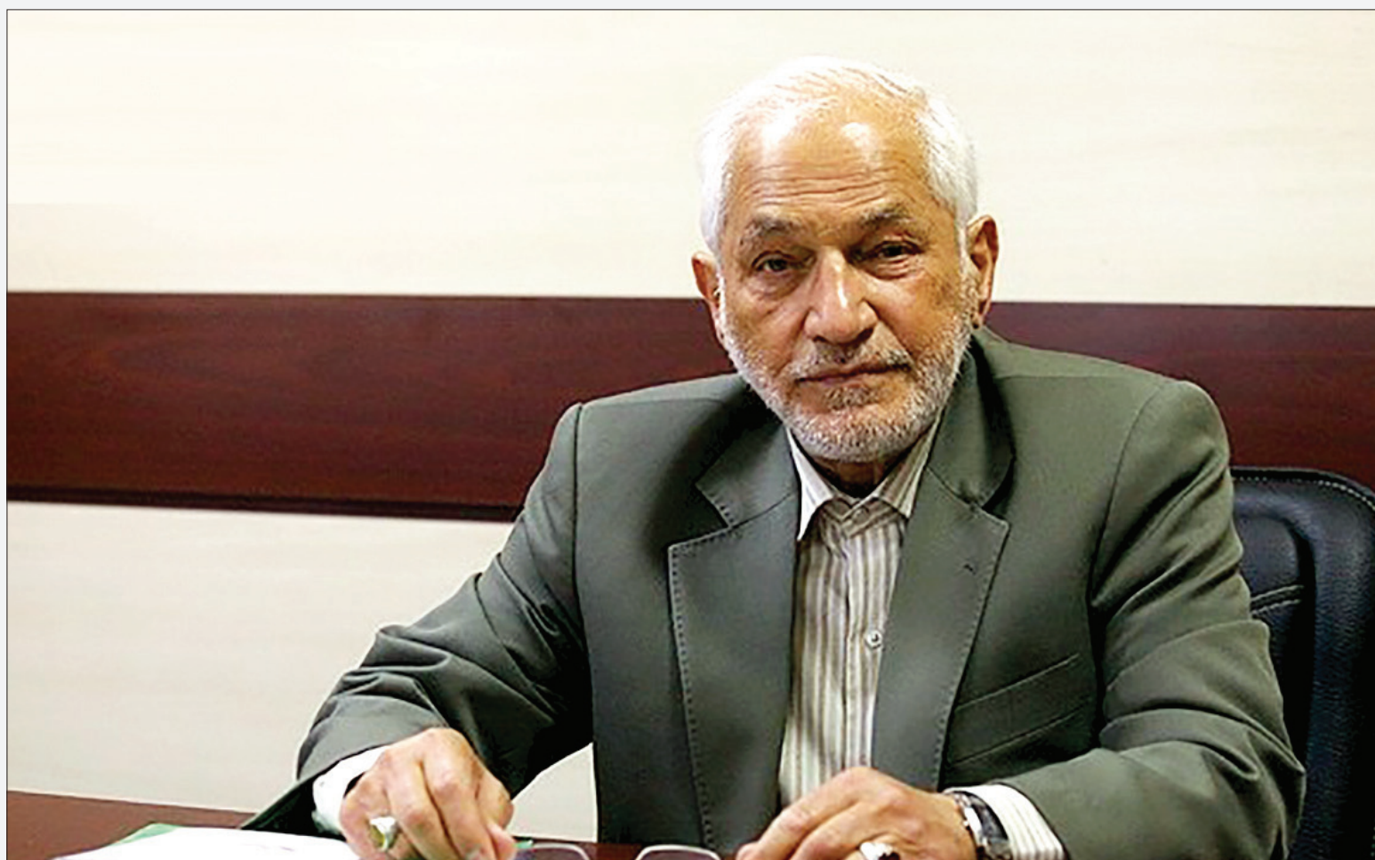
مدیرعامل ستاد دینه کشور: