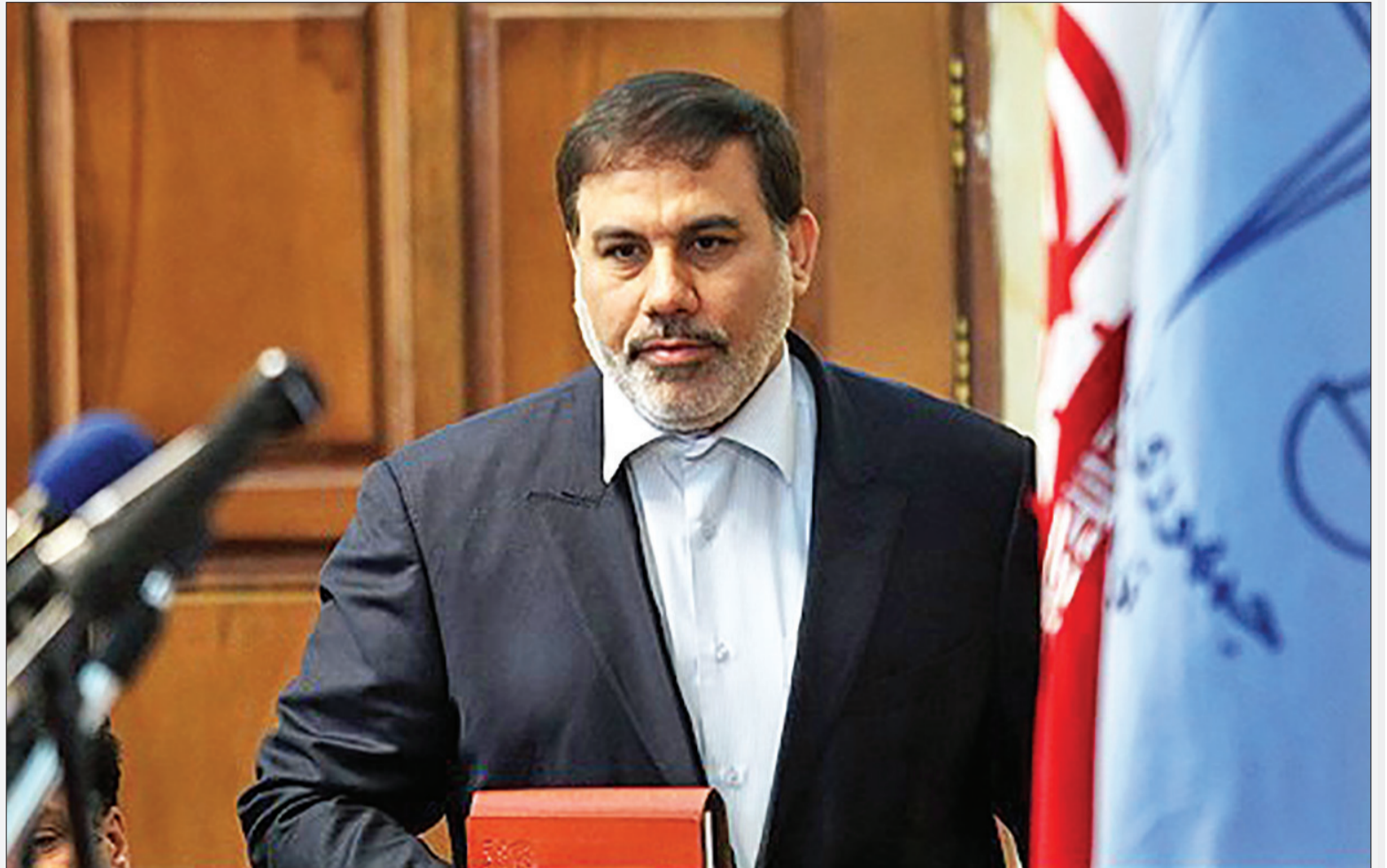
رئیس سازمان زندان‌ها: